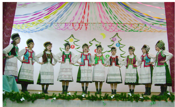
„Chodzenie z Gwiazdą” i pastorałki na Wigilii Kurpiowskiej w Lelisie