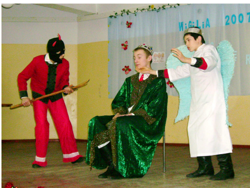
„Król Herod” podczas Wigilii w Czarni

W związku ze zbliżającymi się świętami Bożego Narodzenia i Nowego Roku składam życzenia wszystkim członkom Towarzystwa Kurpiowskiego „Strzelec” w Czarni, członkom zespołu „Carniacy, ich rodzicom, naszym sponsorom i lokalnym władzom: