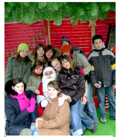
Pamiątkowe zdjęcie z Mikołajem