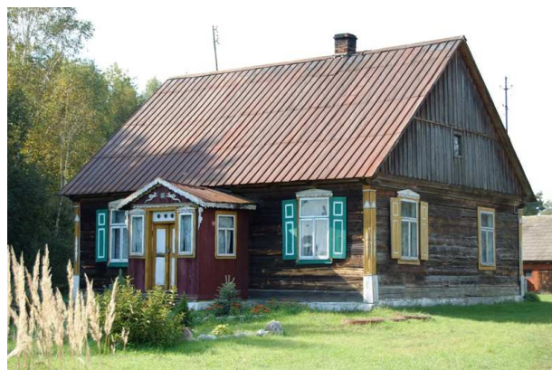
Ryc. 7. Dom w centrum Bandyś z elementami zdobnictwa kurpiowskiego