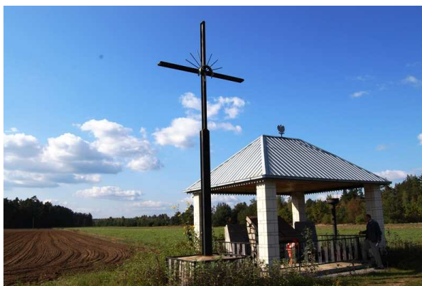
Ryc. 6. Pomnik ofiar reżimu hitlerowskiego

Ciekawy jest również drewniany dom z XXw. z ozdobami w stylu kurpiowskim, który jednak nie jest wpisany do ewidencji zabytków. Architektura kurpiowska charakteryzuje się występowaniem ozdób na dachu przypominających poroża zwierząt, które zwane są śparogami. Okna zdobią rzeźbione nad- i podokienniki.