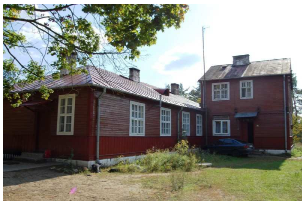
Ryc. 9. Budynek Szkoły Podstawowej w w Bandysiach

Obiektami infrastruktury społecznej są: Szkoła Podstawowa w Bandysiach oraz budynek remizo-świetlicy, który pełni jednocześnie funkcję miejsca spotkań mieszkańców i remizy Ochotniczej Straży Pożarnej. Szkoła to drewniany budynek z 1956 roku, w którym funkcjonuje oddział przedszkolny dla 6-ciolatków oraz klasy I-III. Mieszczą się tu również mieszkania dla pracowników szkoły. Budynek wymaga remontów i dostosowywania do nowoczesnych standardów. W części budynku mieszczą się mieszkania dla nauczycieli.