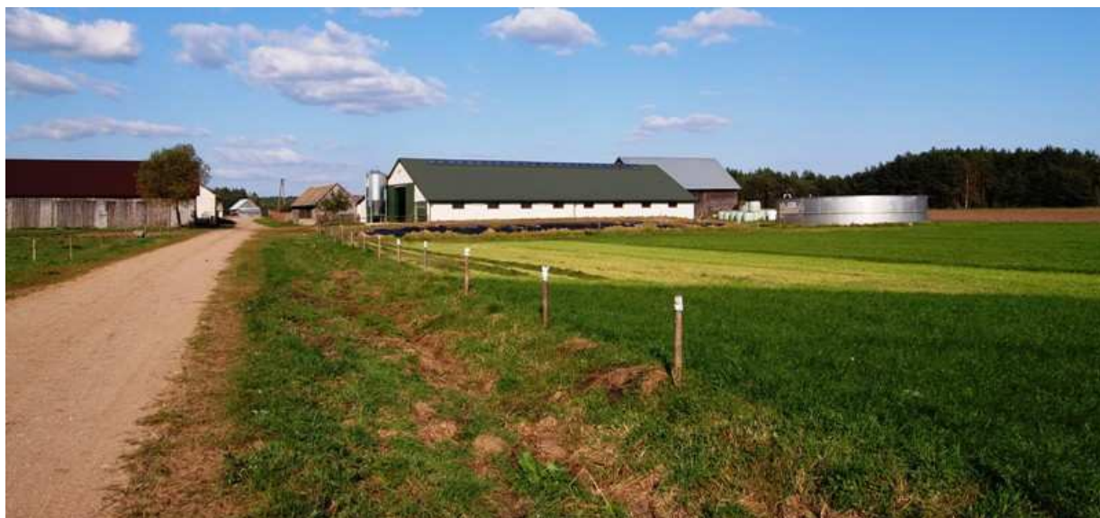
Ryc. 15. Charakterystyczne elementy krajobrazu Bandyś – infrastruktura wykorzystywana w hodowli bydła: obora i zbiornik na gnojowicę.

Część mieszkańców pracuje w sektorze publicznym, usługach i sektorze prywatnym. We wsi działa 8 indywidualnych przedsiębiorców. Ich działalność związana jest z handlem, w tym handlem obwoźnym, oraz z usługami w zakresie remontów i budownictwa. Ważnym problemem zauważanym przez mieszkańców jest bezrobocie – w tym brak pracy wśród młodych osób. Częścią problemu jest ukryte bezrobocie w rolnictwie.