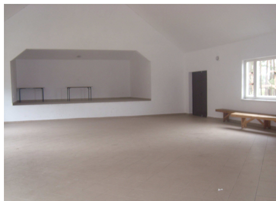
Ryc. 12. Sala główna remizo-świetlicy

Remizo-świetlica to nowy budynek, który wymaga wykończenia zarówno z zewnątrz, jak i wewnątrz. Remiza posiada dużą salę (na spotkania, bankiety), zaplecze kuchenne (bez wyposażenia), toalety, mniejsze pomieszczenia na kameralne spotkania oraz garaż na wóz i wyposażenie strażackie.