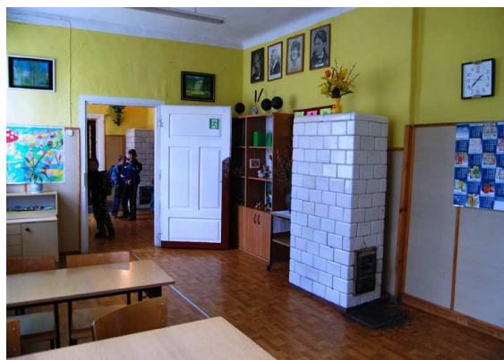
Ryc. 10. Wnętrze szkoły w Bandysiach