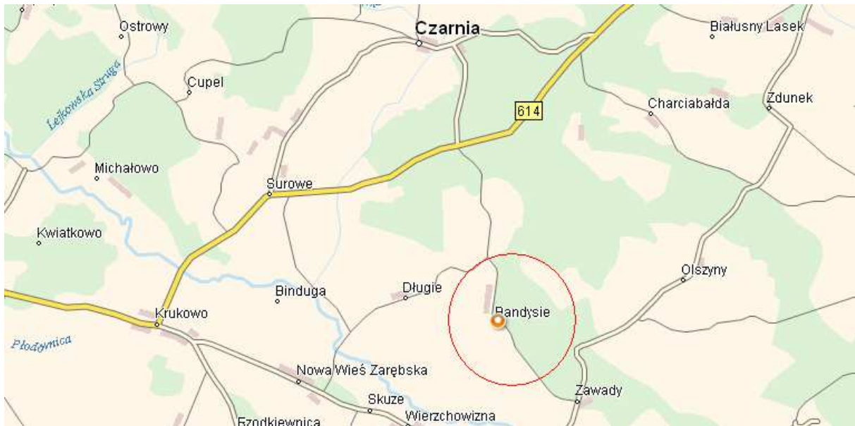
Ryc. 2. Usytuowanie wsi Bandysie w odniesieniu do sąsiadujących wsi oraz miejscowości gminnej – wsi Czarnia.