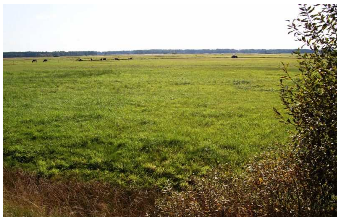
Ryc. 4. Rozległe łąki nad rzeką Omulew.

Roślinność obszaru to przede wszystkim flora siedlisk łąkowych, w tym łąk podmokłych położonych w dolinie rzeki, a także lasy – bory sosnowo-świerkowe i sosnowe. Wśród roślin łąkowych można spotkać interesujące okazy roślin chronionych i rzadkich takich jak storczyki. Pozostałość Puszczy Kurpiowskiej – to zasobne w fitoncydy lasy iglaste, których atrakcją jest bogate w borówczyska i grzyby runo leśne. Charakter roślinności wynika z obecności słabej jakości gleb bielcowych – powstałych na polodowcowych utworach sandrowych i bardziej zasobnych gleb na obszarze zalewowym w dolinie Omulwi. W sąsiedztwie miejscowości Bandysie zlokalizowany jest rezerwat leśny „Czarnia”, w którym zachowały się sosny bartne – wspomnienie po bartniczym okresie w historii Kurpiowszczyzny. Rezerwat chroni fragment starodrzewu sosnowo-świerkowego wraz z roślinami runa i podszytem.