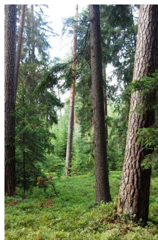
Ryc. 5. Fragment Puszczy Kurpiowskiej w Rezerwacie Czarnia.