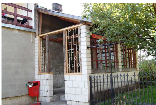
Ryc. 13. Sklep prywatny

Bandysie to wieś o charakterze rolniczym, w której dominującym sposobem gospodarowania jest hodowla bydła mlecznego. Grunty są wykorzystywane jako orne, łąki i pastwiska.