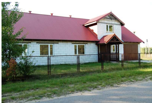
Ryc. 11. Budynek remizo-świetlicy