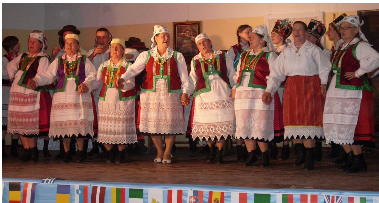
Ryc. 8. Kurpiowska grupa śpiewacza kobiet, z której duża część to mieszkanki Bandyś.

w kurpiowskich strojach ludowych i wykonują tradycyjne pieśni. Charakterystyczne dla kultury kurpiowskiej są dziedziny rękodzieła takiej jak bibułkarstwo (m. in. wykonywanie kwiatów, bukietów i palm z bibuły – bardzo rozpowszechniona umiejętność wśród mieszkanki Bandyś), haft, wycinankarstwo, ozdabianie pisanek, pieczywo obrzędowe. Istnieje tradycja wytwarzania byśków oraz tzw. „nowego latka” – figurek z pieczywa. Kurpie mają swoje tradycyjne potrawy i napitki. Najbardziej znane jest piwo kozicowe sporządzane z udziałem jałowca oraz dar puszczy, zwany też mioduszką, czyli bimber zaprawiony miodem i przyprawami. W kuchni kurpiowskiej znajdziemy rejbak – zapiekanek ziemniaczaną z mięsem, kapustę z grochem, kaszę jaglaną na oleju lnianym z cebulą, drożdżak (placek drożdżowy).