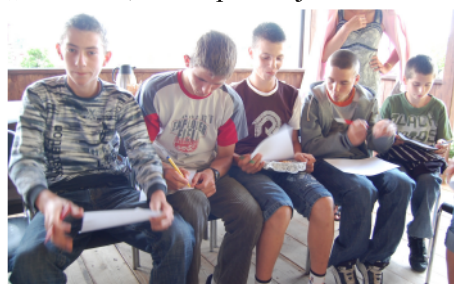
Spotkanie integracyjne w Czarni.

W akacje mogą być czasem zdobywania wiedzy i nowych umiejętności. Od czerwca młodzież uczestnicząca w projekcie pod nazwą "EXTREME TEAM", prowadzonym przez Towarzystwo Kurpiowskie „Strzelec”, nie próżnuje! W dzień