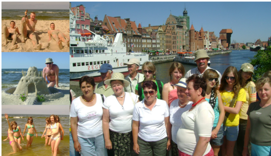
Członkowie Kurpiowskiego Zespołu Folklorystycznego Carniacy odpoczywali nad Bałtykiem. Informacje o tej wyprawie i o ostatnich sukcesach Zespołu znajdziecie Państwo na stronie 7.