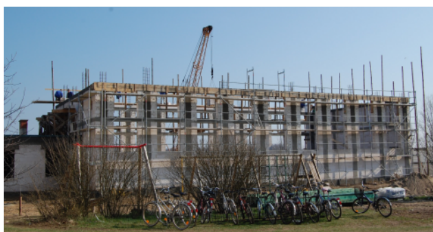
Budowa sali gimnastycznej w Surowem - kwiecień.

Obecnie budowa jest bardziej zaawansowana.