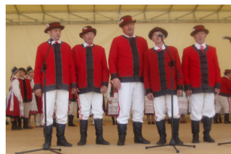
Kurpiowskie śpiewy mężczyzn.

wsi. Dla nich organizowane są konkursy. Nasza gmina brała udział w konkursie na „Najlepszy produkt tradycyjny”, który rozegrany był w dwóch etapach: powiatowym i wojewódzkim. Do finału zakwalifikowały się 3 produkty.