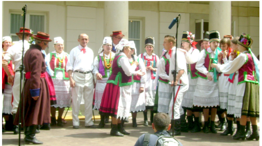
Widowisko "Rajby" w Łazienkach Królewskich w Warszawie.

W węgrowskim festiwalu brało udział 6 wyselekcjonowanych zespołów. Nasz zespół zdobył tu I nagrodę. Podkreślono w uzasadnieniu jury, że zespół otrzymuje nagrodę za dobrą grę aktorską, pielęgnowanie tożsamości regionalnej oraz ciekawy scenariusz widowiska. Pokazywaliśmy tam widowisko pod tytułem „Rajby”, którego recenzję już wcześniej opisywaliśmy w lokalnych gazetach, przy okazji odwiedzenia zespołu w lutym przez Wojciecha Siemiona wraz z komisją artystyczną. W Węgrowie w nagrodę otrzymaliśmy 3500zł. Wieczorem bawiliśmy się świetnie przy zespole „Kombi” i kilku zagranicznych zespołach folklorystycznych. Cieszymy się bardzo, że jurorzy węgrowskiego festiwalu