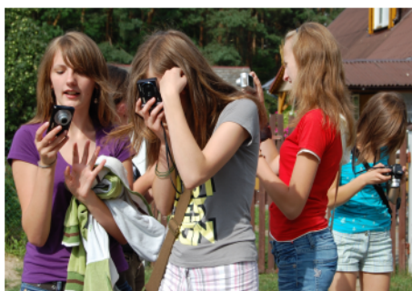
Plener fotograficzny w Czarni.

rozdziania świadectw młodzież gimnazjalna z Czarni i Surowego, łącznie 18 osób, spotkała się z równie liczną grupą gimnazjalistów z Baranowa. Spotkanie miało na celu wzajemne poznanie się.