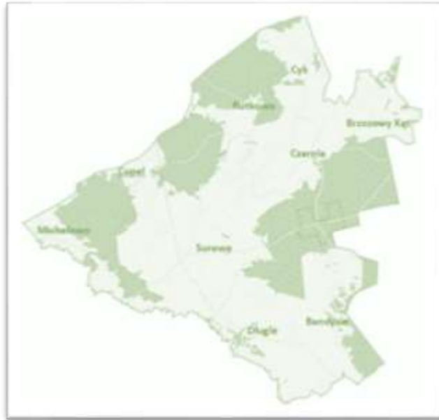
Rysunek 2 Podział gminy na Sołectwa

Administracyjnie gmina podzielona jest na 9 sołectw obejmujących 9 miejscowości. Powierzchnia gminy to około 93,85 km 2 , co czyni gminę Czarnia jedną z najmniejszych gmin w powiecie ostrołęckim. Gminę Czarnia charakteryzuje malowniczy krajobraz, lesistość i świeże powietrze, które dają wiele możliwości rozwoju turystyki i wypoczynku. Znakiem rozpoznawczym gminy jest krzewiona od pokoleń tradycja Kurpiowska.