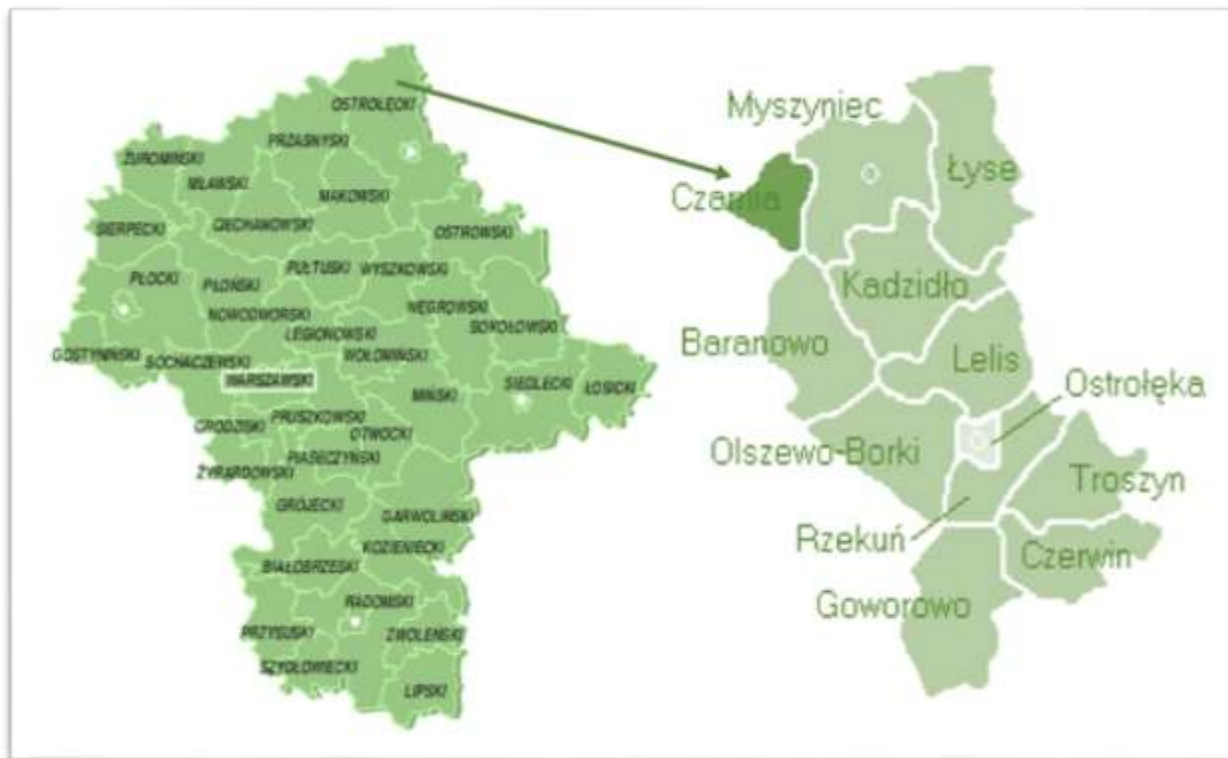
Rysunek 1 Gmina Czarnia na tle województwa mazowieckiego i powiatu ostrołęckiego

Gmina Czarnia leży na północnym skraju Mazowsza, w powiecie ostrołęckim. Od północy graniczy z województwem warmińsko-mazurskim.