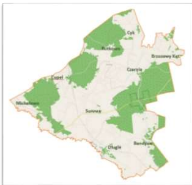
Rysunek 2 Podział gminy na Sołectwa

Administracyjnie gmina podzielona jest na 9 sołectw obejmujących 9 miejscowości. Powierzchnia gminy to około 93,85 km 2 , co czyni gminę Czarnia jedną z najmniejszych gmin w powiecie ostrołęckim. Gminę Czarnia charakteryzuje malowniczy krajobraz, lesistość i świeże powietrze, które dają wiele możliwości rozwoju turystyki i wypoczynku. Znakiem rozpoznawczym gminy jest krzewiona od pokoleń tradycja Kurpiowska.