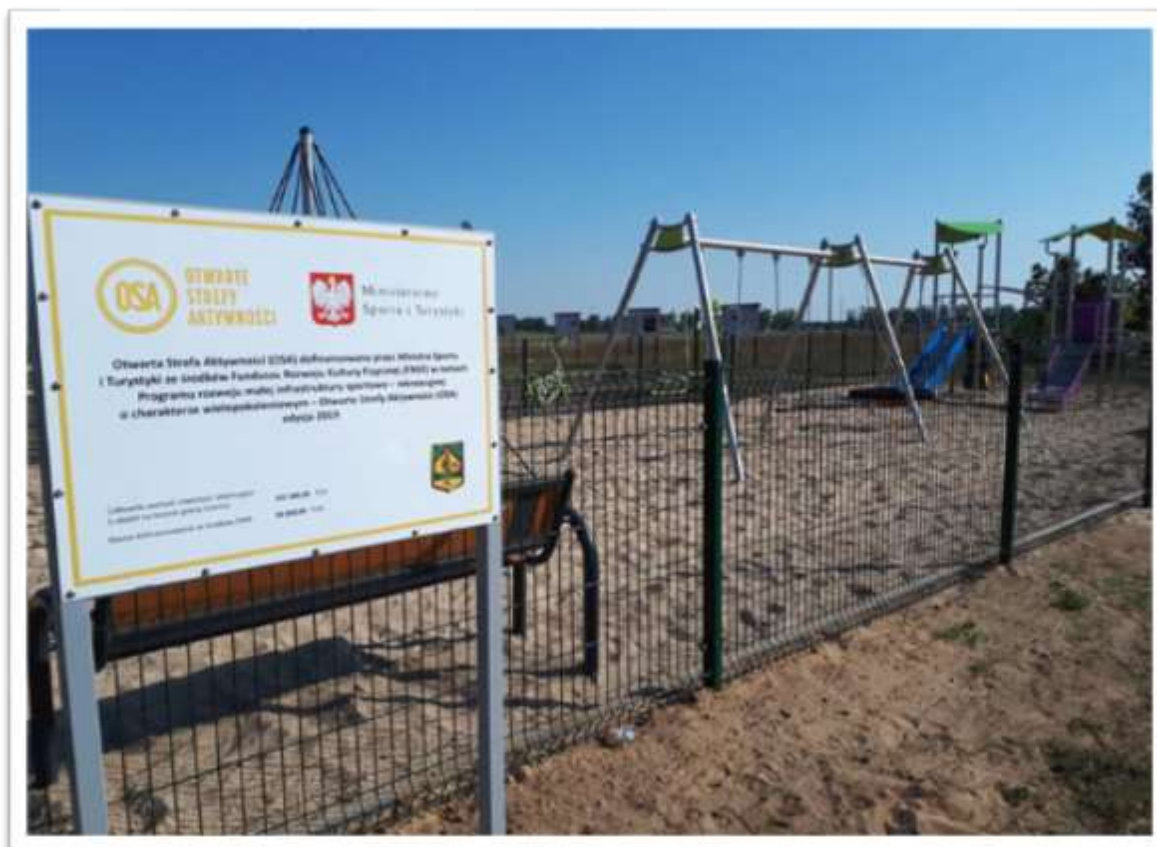
Rysunek 3 Otwarta Strefa Aktywności w Surowem